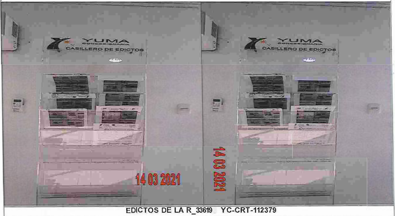
EDICTOS DE LA R_33619 YC-CRT-112379